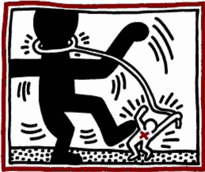
[FREE SOUTH AFRICA]

3) CONFRONTA LE IMMAGINI PRESENTI NELLA TABELLA, SCEGLINE DUE E COMMENTALE