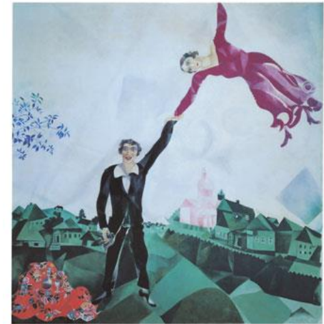
M. Chagall – la passeggiata