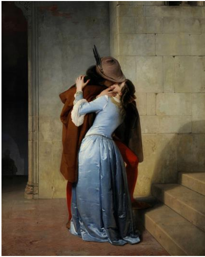
F. Hayez – Il bacio