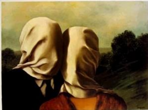
R. Magritte – gli amanti