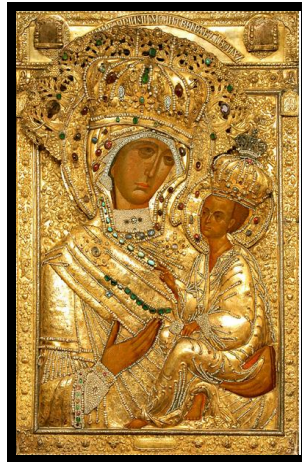
Icona Bizantina sec. XIV