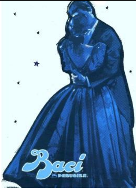
pubblicità di cioccolatini