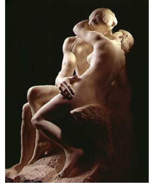
A. Rodin – il bacio