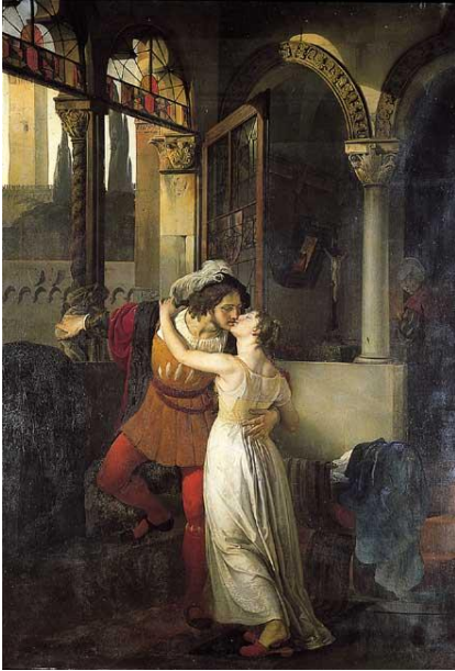
F. Hayez – l'ultimo bacio