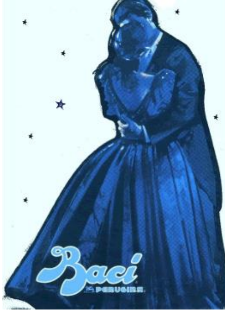
pubblicità di cioccolatini